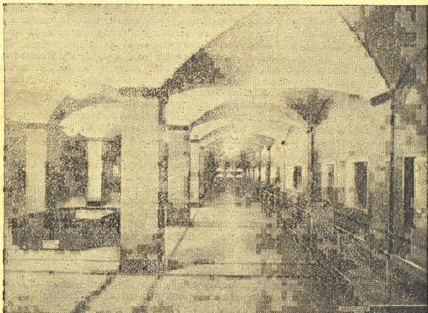
Sala del acuario del Departamento de Pesca, en Washington.