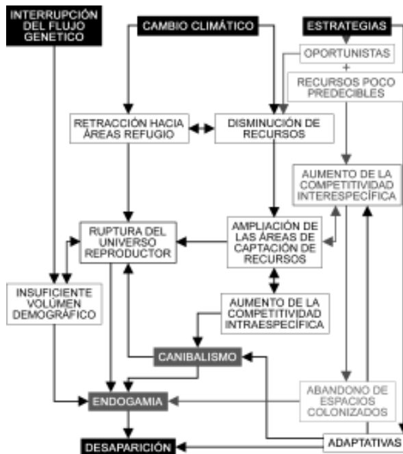
Fig. 3. Esquema resumen de los diferentes factores interrelacionados que pudieron influir en la interrupción del segundo episodio de poblamiento europeo.

Litoestratigrafía y micromamíferos de TD6 reflejan una secuencia de pulsaciones frías con descenso progresivo de temperaturas (Hoyos y Aguirre 1995; López Antoñanzas y Cuenca-Bescós