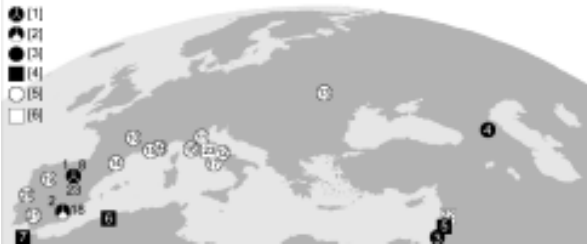
Fig. 1. Localización geográfica de los yacimientos que documentan los episodios de dispersión de homínidos mencionados en el texto. [1] Documentan los tres; [2] Documentan los dos primeros; [3] Dispersión del Pre-Olduvaiense; 1. Atapuerca TE; 2. Barranco León-5 y Fuente Nueva-3; 3. Yiron y 'Erq-el-Ahmar; 4. Dmanisi. [4] Dispersión del Olduvaiense evolucionado/Achelense antiguo; 5. Tell 'Ubeidiya y Evron Quarry; 6. Ain Hanech. 7. Thomas Quarry 1. [5] Segundo episodio de poblamiento europeo: 8. Atapuerca TD; 9. Vallonet; 10. Soleihac; 11. Ca' Belvedere di Ponte Poggiolo; 12. Ceprano; 13. Korolevo y Rossokovo; 14. Localizaciones de los Pirineos occidentales; 15. Vidauban; 16. Collinaia y Bibbona; 17. Arce, Fontana Liri y Castro dei Volsci; 18. Cúllar de Baza-I; 19. Monfarracinos; 20. Quinta do Cónego/Pusias; 21. Guadalquivir T-6. [6] Yacimientos correspondientes al Achelense pleno mencionados en el texto: 22. Geshen Benot Ya' aqov; 23. Isernia la Pineta.

Se documenta un segundo poblamiento en las últimas fases de Matuyama, circunscrito a latitudes meridionales (Fig. 1). Desarrollado entre OIS25/OIS24 y OIS19/OIS18, está representado por Atapuerca Gran Dolina (A-TD) 4-6; Vallonet; Soleihac; Ca' Belvedere di Monte Poggiolo; Ceprano; y, posiblemente con cronologías cercanas al Episodio Jaramillo, Korolevo VII-VIII y Rossokovo. A tenor de una publicación preliminar, se uniría la Cueva de Santa Ana (Carbonell et al. 2005a). El final de este proceso se documenta en conjuntos ibéricos datados inmediatamente después del límite M/B, ente OIS19 y la transición OIS19/OIS18 (Raposo y Santonja 1995): A-TD7; Cúllar de Baza I; Monfarracinos; Quinta do Cónego/Pusias y Guadalquivir T6. Cabría añadir algunas localizaciones sin elementos fiables de datación, penecontempo-