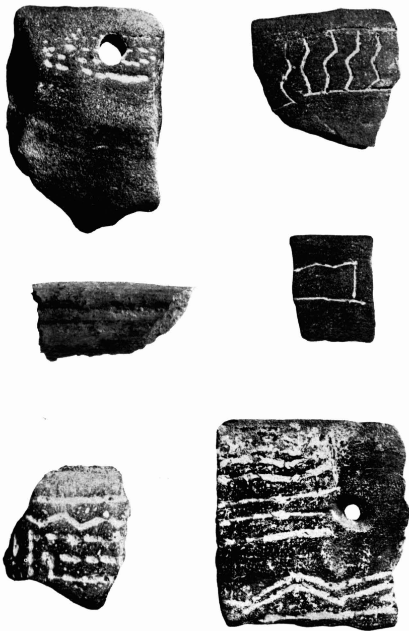
Diferentes tipos de cerámica decorada hallados en la capa humifera de Palo Blanco. (Tamaño natural.)