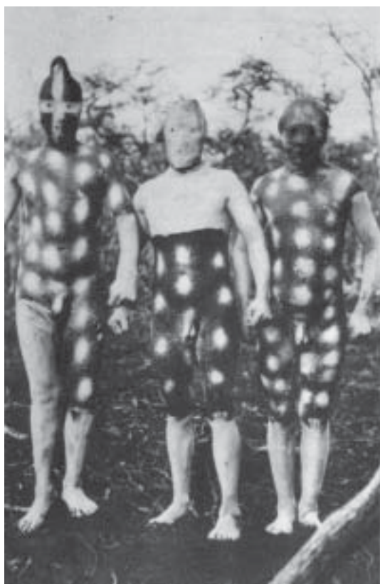
Figura 4. Tres espíritus So'ort subordinados durante la ceremonia del hain (foto tomada por Gusinde en 1923 y publicada por Gusinde 1989 [1939], apéndice II, pp. 631, figura 77). Three subordinate So'orte spirits during the hain ceremony (photo taken by Gusinde in 1923 and published by Gusinde 1989 [1939], appendix II, pp. 631, figure 77).

las que habían sido “insubordinadas”. Este era su sergido por sus maridos u otros hombres de la familia, arribando al campamento doméstico, sacudiendo las chozas y arrojando elementos fuera de éstas (Gusinde 1982:827). Pero, además, los So'ort se paseaban frente a la choza ceremonial, sin ingresar al campamento. Mientras que en el primer caso las mujeres se sentían amenazadas y no disfrutaban de su presencia, en el segundo caso consideraban que So'ort era hermoso (Chapman 1982:103), e incluso podían hacerlo aparecer mediante cánticos específicos (Chapman 1982:97). De esta manera, la pintura corporal de So'ort contribuía a su doble rol como agente de control social, pero también de seducción de los hombres sobre las mujeres. Esta ambivalencia de las mujeres acerca de los So'ort , facilitada por las pinturas que simultáneamente transformaban su identidad humana y los