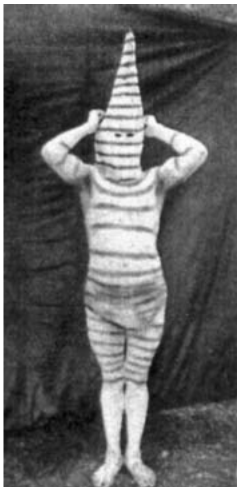
Figura 7. Espíritu Yamana del kina , de nombre desconocido (foto tomada por Gusinde en 1922 y publicada en 1937: apéndice, figura 30).

Existe una gran discrepancia entre la información visual y la escrita acerca de los “espíritus” del kina . Las fotografías no documentan la variedad de diseños que se mencionan en los textos. La razón por la cual Gusinde y Koppers no fotografiaron mayor cantidad de “espíritus” no está clara. Es posible que no fotografiaran la totalidad de los espíritus presentados y que solamente los registraran por escrito. Además, durante la ceremonia observada en 1922 algunos espíritus no fueron repre-