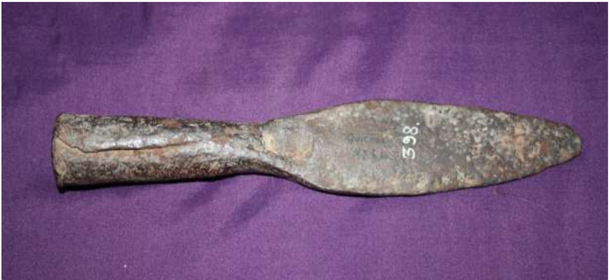
Dos piezas pertenecientes a la Colección Bruch y actualmente identificadas como de origen europeo que fueron clasificados originalmente como elementos sin procedencia clara.

la historia de la arqueología nacional, reflejando tanto los criterios de recolección de material que definieron la disciplina en sus diferentes etapas, como los criterios que guiaron la tarea particular de ciertos investigadores, la influencia que sus distintas formaciones académicas pudieron tener en dicha actividad y